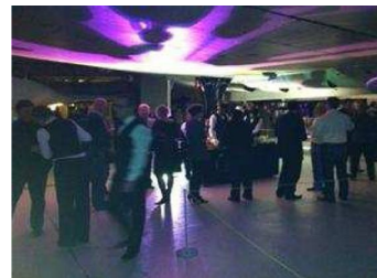
帝国戦争博物館での夕食会の写真

ISOE シンポジウム、RPM および規制当局代表者の最初の会合から、放射線防護の専門家は足並みの揃った熱意を持ち、共通の課題に取り組む世界的なコミュニティーであることが示された。私たちは効果的にネットワークを作り、経験を共有することにより、今後の成功に向けての機会を高めていく。